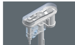
พูลเลย์ / Pulley